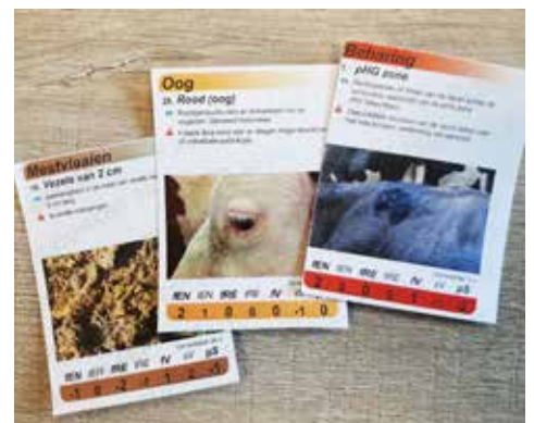
Kaartset of app Obsalim is te gebruiken via een kaartset of als smartphone app. Beide zijn vertaald naar het Nederlands