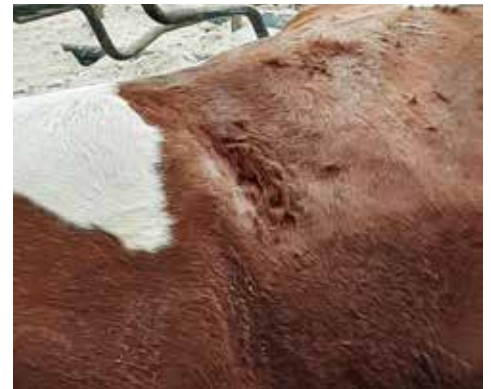
Zone Giboudeau De pHg-zone (zone Giboudeau) is een likplek achter de schouder, twee uur na opnemen verzurend voer.